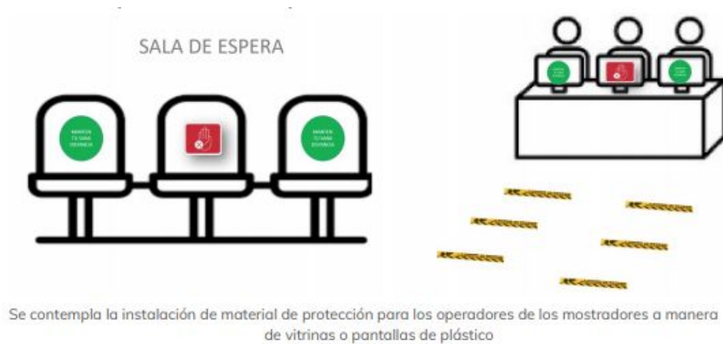
Se contempla la instalación de material de protección para los operadores de los mostradores a manera de vitrinas o pantallas de plástico

Se deberá señalizar en el piso los espacios que deberán respetar los clientes para solicitar los productos o para pagar.